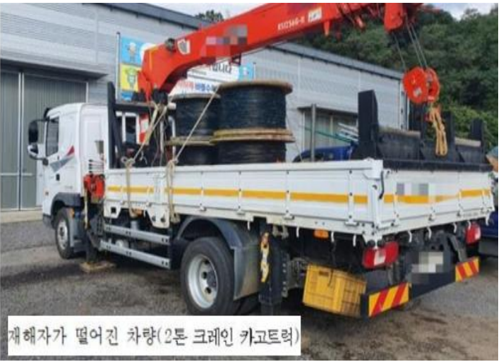
재해당시 현장 사진