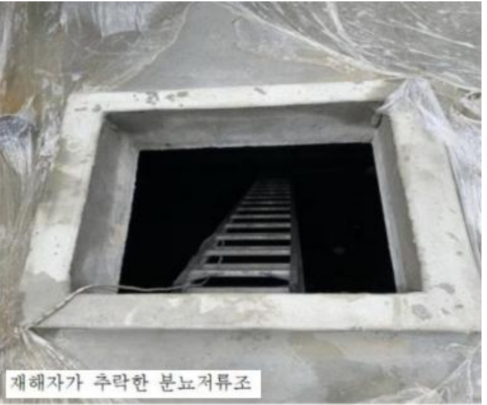
사고 현장 전경 사진