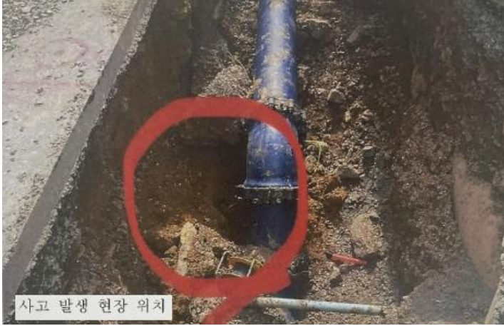
사고 발생 현장 위치