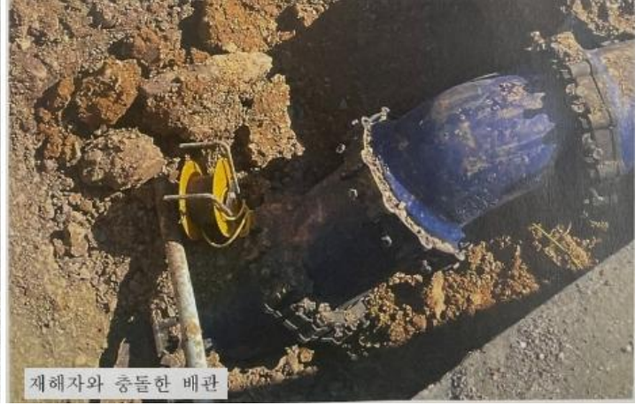
재해자와 충돌한 배관

23.6.8(목) 11:30경 경북 영천시 망정동 소재 「상수도시설 개선공사」 현장에서 관로공사 배관설치 후 볼트체결을 완료하고 재해자가 일어나는 순간 등 뒤쪽 굴착단면에 부딪쳐 토사가 무너졌고 그 충격으로 재해자의 흉부가 배관에 부딪쳐 사망