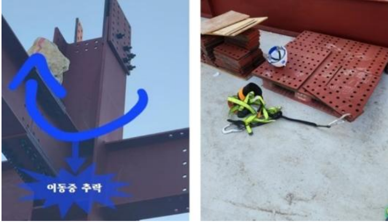
23.6.3.(토) 11:07경 경기 포천시 소재 「○○○ 공장 신축공사」 현장에서 재해자가 철골기둥(높이 약 7m)위에 올라가 철골 부재 점검을 위한 볼트 가체결 작업 도중 작업 위치를 변경하려다 추락하여 사망