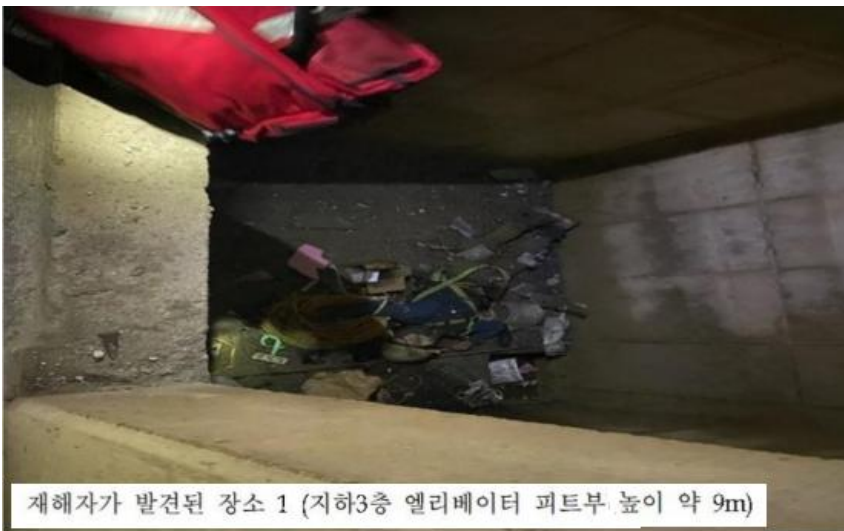
23.6.3.(토) 8:10경 세종시 소재 「세종 금호건설 주상복합 신축공사」 현장에서 활석작업자가 지하 3층(높이 약 9m) 엘리베이터 피트부 바닥에 쓰러져 있는 재해자를 발견하였으나 사망 재해자는 지난 1일부터 벽면의 돌출 부분을 다듬는 활석 작업에 투입된 것으로 알려졌는데, 사고 당시 혼자 작업하고 있어 목격자는 없었다.