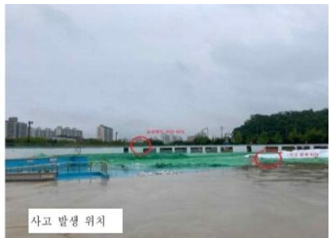
사고 발생 위치

23.5.27.(토) 7:30경 경기 안산시 상록구 소재 「○○수영장 조성사업」 현장에서 막 구조물 보양을 위해 이동식크레인을 이용하여 막 구조물을 끌어당기는 작업을 하던 중 아이볼트와 도르래를 연결하고 있던 슬링벨트가 끊어지면서 도르래가 당시 현장에서 이동식크레인 기사와 무전기로 업무소통을 하고 있던 재해자의 얼굴에 맞아 사망