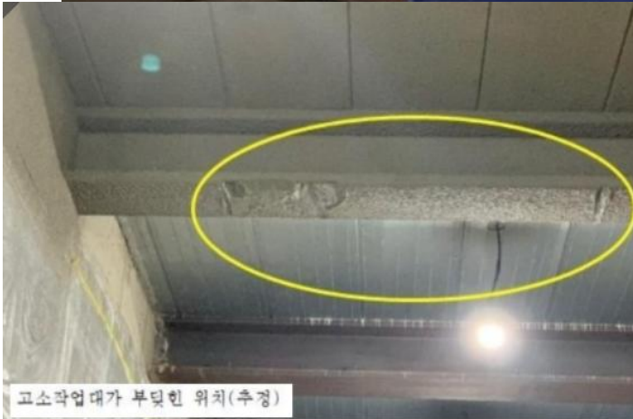
고소작업대가 부딪힌 위치(추정)

23.5.31.(수) 13:41경 경기 수원시 장안구 소재 「수원 스타필드 신축공사」 현장 램프구간에서 고소작업대를 이용하여 뿔철 작업 중이던 신세계건설 하청업체소속 재해자가 고소작업대 조작 중 천장구조물에 부딪혀사망