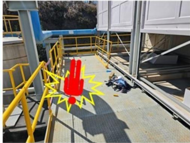
[사진2] 재해자가 떨어진 장소

○ 추락 위험 장소 작업 시 안전대 체결 등 추락방지조치 실시 및 관리감독자 확인 철저