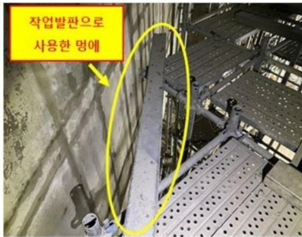
[사진2] 재해당시 작업발판으로 사용한 멩에

○ 추락 위험 장소 작업 시 안전대 체결 등 추락방지조치. 실시 및 관리감독자 확인 철저