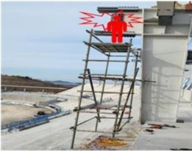
[사진1] 재해발생현장 전경