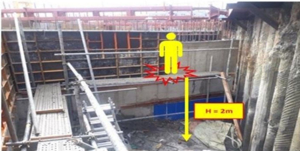
[사진] 재해발생 현장 전경

'23.2.14.(화) 08:20경 하청업체 소속 재해자가 지하1층 벽체 거푸집 해체 작업 중 작업발판에서 바닥으로 떨어져 사망함