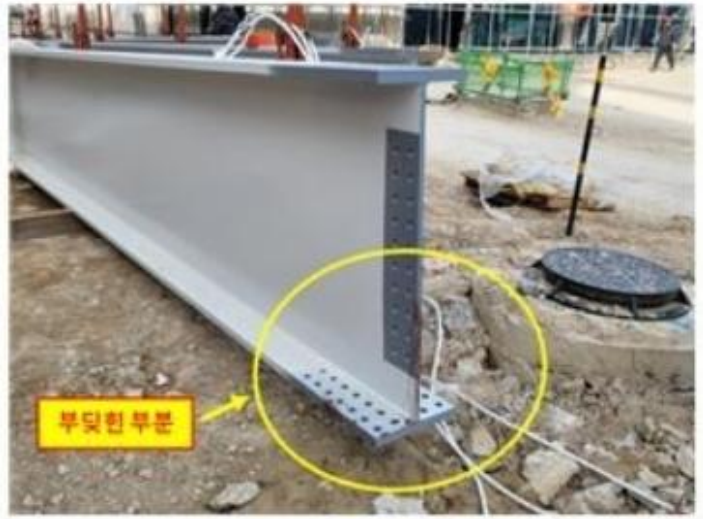
[사진2] 기인물 철골 거더

○ 중량물 취급 작업 시 현장 여건에 맞는 안전한 작업방법 반영한 작업계획서 작성 및 작업내용 관계근로자 공유 후 작업 실시