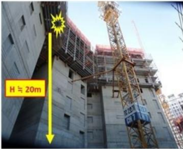
[사진1] 재해발생현장 전경

작업발판 발끝막이판 설치를 하던 중 몸의 중심을 잃고 안전난간 사이 개구부로 떨어져 사망함