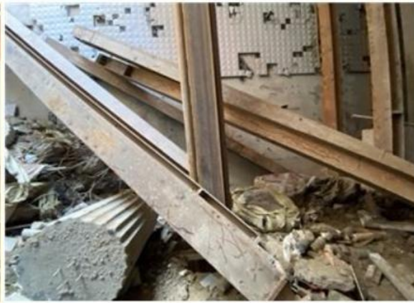
[사진1] 재해발생 장소 전경