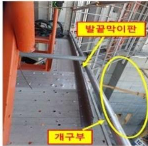
[사진2] 재해 발생 장소

○ 추락 위험구간 작업 시 안전보호구(안전대 등) 착용 및 추락방지조치 철저