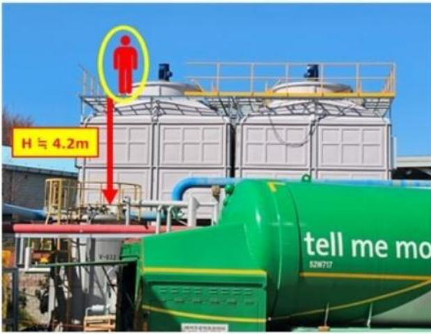
[사진1] 재해발생현장 전경