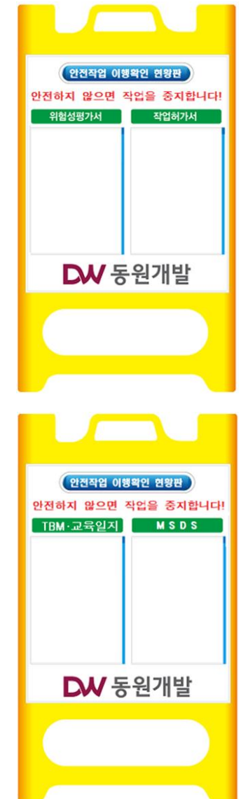
PE게시판 (포맥스3T, A4 지퍼백) 양면