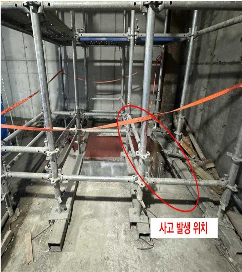
사고 발생 위치