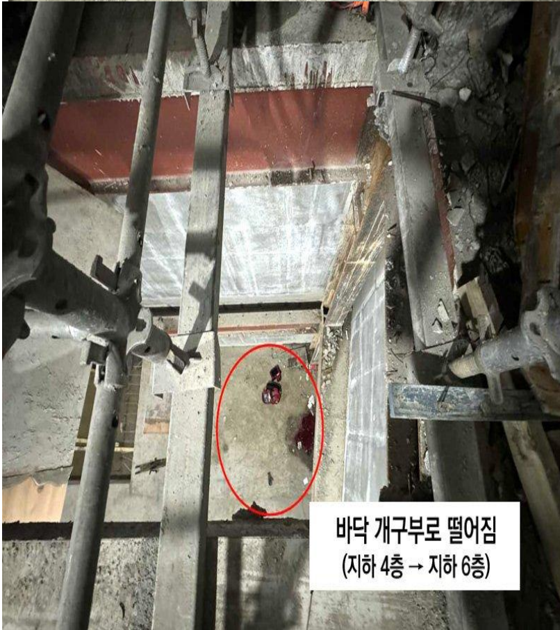
바닥 개구부로 떨어짐 (지하 4층 → 지하 6층)