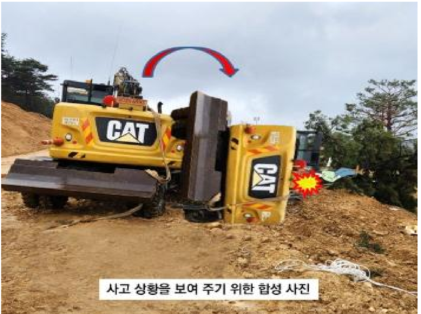
사고 상황을 보여 주기 위한 합성 사진