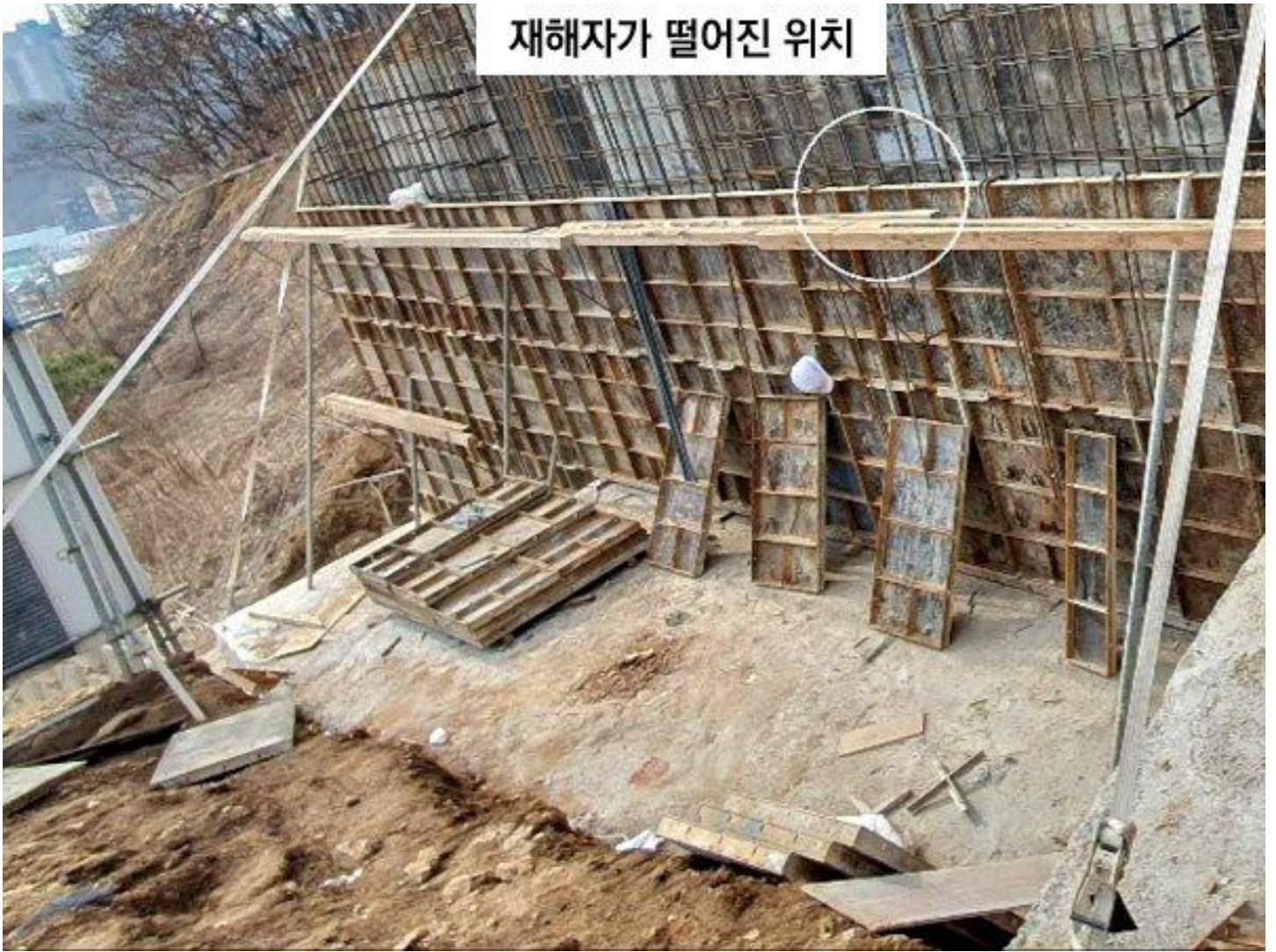
재해자가 떨어진 위치