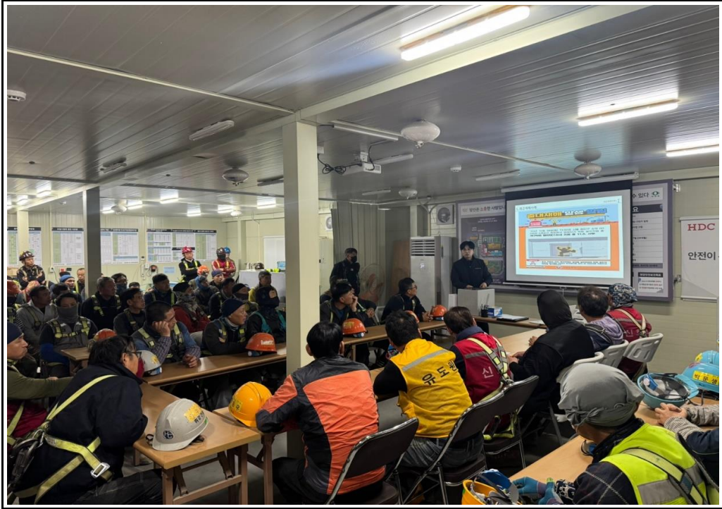
사 진 설 명 위험성평가 전파교육 일 자 24.11.15