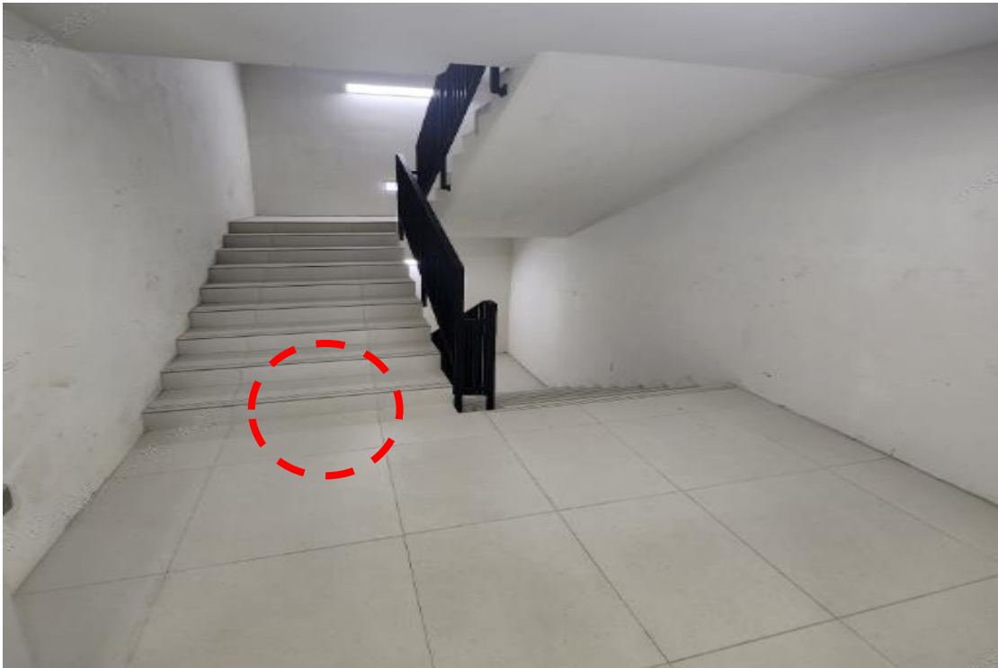
현장 사진(발생 위치)