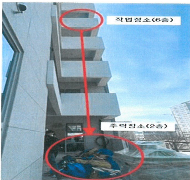
[사진1] 재해발생현장 전경

벽체 평탄화(할석) 작업을 위해 설치된 이동식 비계로 올라가다 2층 베란다 바닥으로 떨어져(H≒15.2m) 사망함