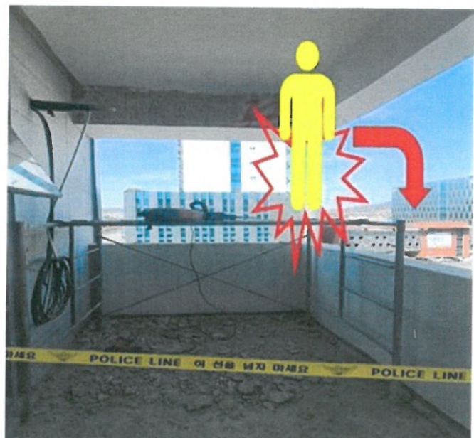
[사진2] 재해발생 장소