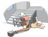
작업 중 굴착기가 넘어지면서 운전석에서 이탈한 운전자 깔림