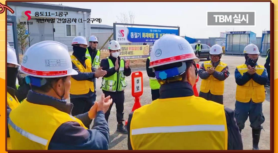
송도11-1공구 기반시설 건설공사 (1-2구역)

아침조회와 TBM으로 시작하는 현장의 하루 시작을 가감없이 보여주어 TBM 활동의 중요성을 일깨움