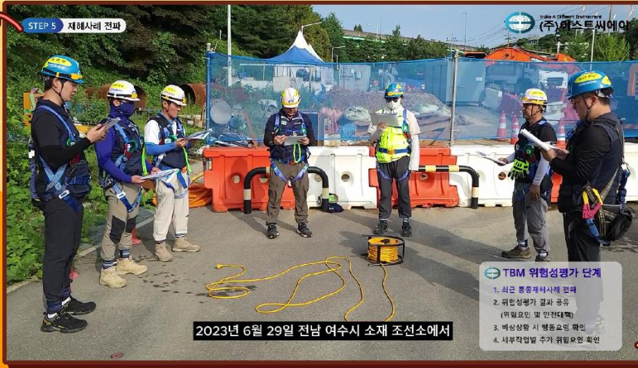
2023년 6월 29일 전남 여주시 소재 조선소에서

위험성평가에 기반한 작업 전 안전점검회의(TBM) 활동을 통해 근로자들에게 올바른 TBM 가이드 전달